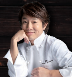
宮崎県出身 川越シェフ監修